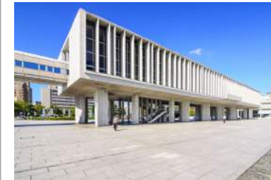
Hiroshima Peace Memorial Museum