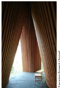
Sayama Forest chapel