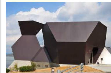
Toyo Ito museum of architecture