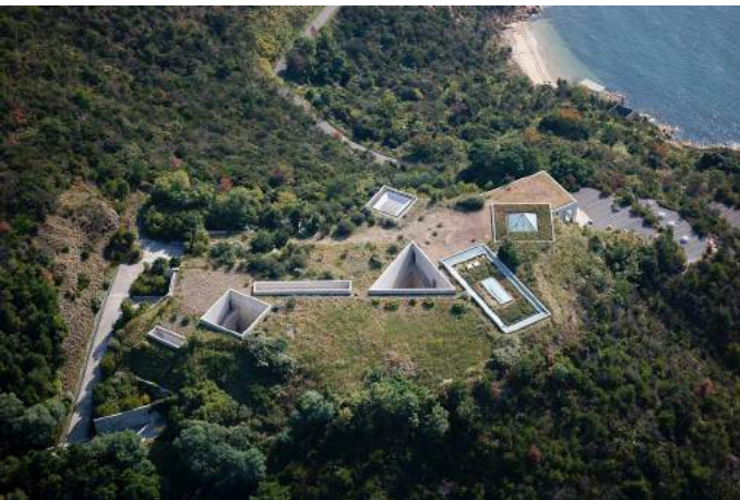
Chichu Art Museum