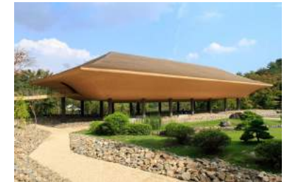
Temple Shinshoji, musée zen et jardin