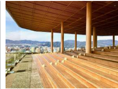
Hiroshima orizuru Tower