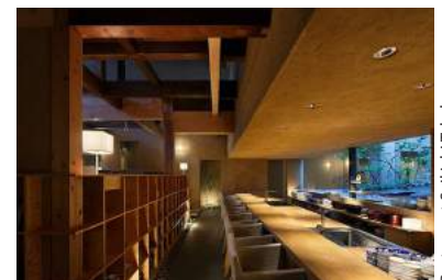
Restaurant Seikichi Takahara