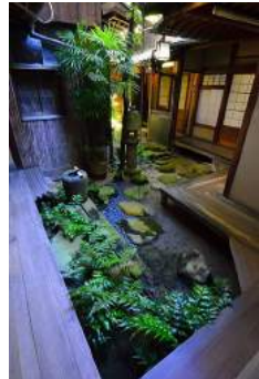
Auberge Ryokan à Onomichi